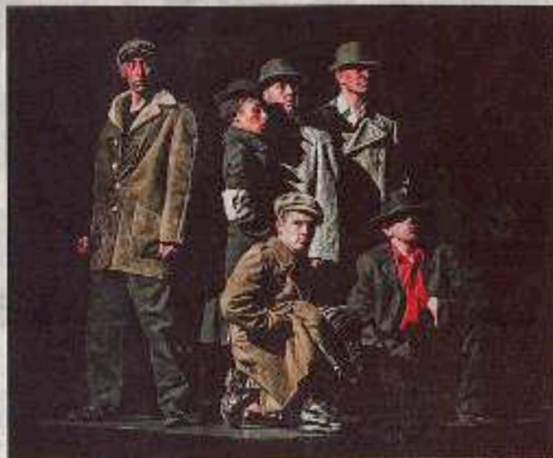
À Nos Morts, l'hommage aux tirailleurs par la compagnie Mémoires Vives, ce soir au PRÉO.

► « Colins de paradis » , de Christine Riehl, librairie Au Bonheur des Livres, 11 rue du Général-de-Castelnau, de 14 h à 19 h. Gratuit. ☎ 03 88 24 20 50.