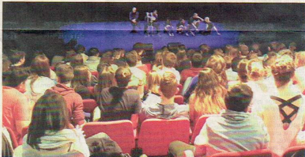
La pièce rend hommage aux « indigènes » qui se sont battus aux côtés des soldats français durant la Première Guerre mondiale.

Le spectacle s'adresse tout spécialement aux jeunes, afin qu'ils connaissent l'histoire de