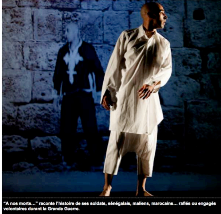
"A nos morts..." raconte l'histoire de ses soldats, sénégalais, maliens, marocains... rafiés ou engagés volontaires durant la Grande Guerre.

La compagnie Mémoires vives présentera vendredi 24 janvier, son spectacle "À nos morts" à l'auditorium Jean-Moulin dans le cadre du centenaire de la guerre 14-18.