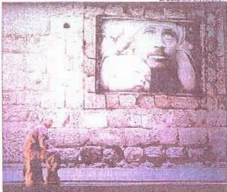
Cette création mêle danse, chant, hip hop et vidéo.